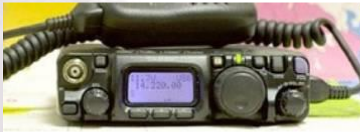
Radio HF portatif QRP ex: Yaesu FT817