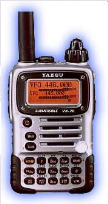
Appareil portatif ex: Yaesu VX7