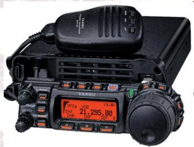
Radio HF pleine puissance ex: Yaesu FT857